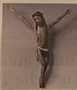
▲ Legno Crocifisso del XIV secolo