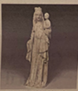
▲ Pietra Vergine del XIV secolo