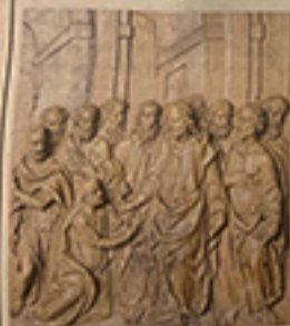
▲ Legno Pannello per coro

Chiave Fine Arte, via Stefano Templa 22, Racconigi Info 01 72 85284-339 7987801 chiavefineart.com